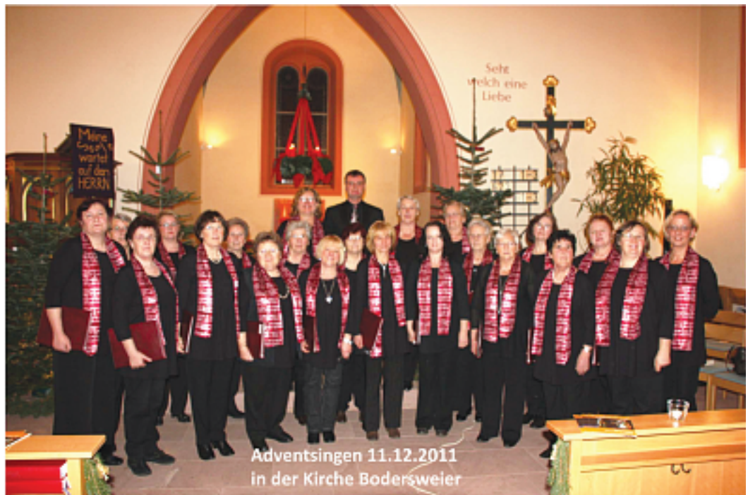
Adventssingen 11.12.2011 in der Kirche Bodersweier