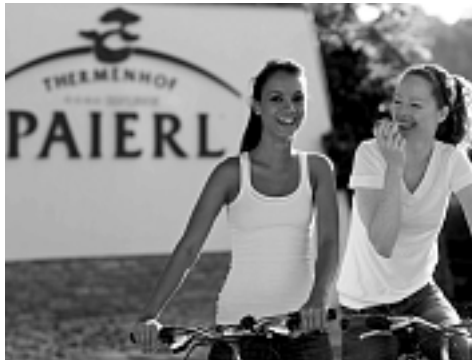
Fit und gesund in den Frühling

Frühlingserwachen im ****Superior Hotel Thermenhof Paieryl in der Steiermark