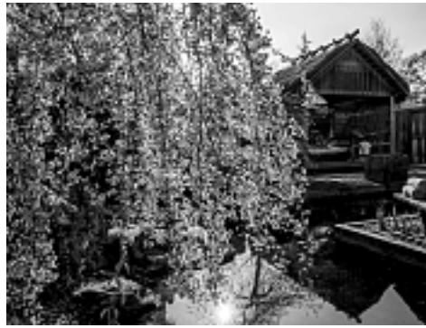
Frühlingserwachen in Bad Waltersdorf

In der herrlichen Landschaft der Steiermark, im Herzen Österreichs, befindet sich das familiär geführte, gehobene 4-Sterne-Wellnesshotel Thermenhof Paieryl.