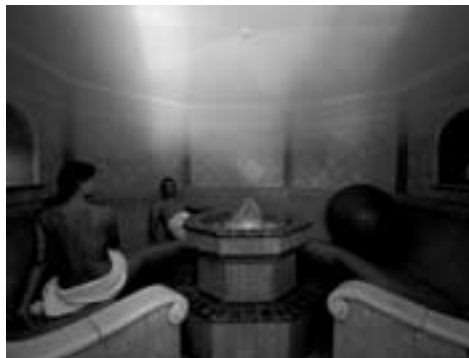
Wohlthuendes Soledampfbad im Quellenhotel & Spa****

Wenn kalte Winterluft auf die Wärme der Therme trifft, bricht in der Thermenregion Bad Waltersdorf eine Zeit voll Ruhe und Entspannung an. In Bad Waltersdorf können Besucher in der vorweihnachtlichen Atmosphäre des Thermenadvents Ruhe und Entspannung finden.