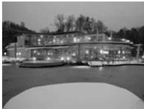
Träumhaft idyllisch, das Quellenhotel & Spa**** der Heiltherme Bad Waltersdorf

Quellenhotel & Spa**** Heiltherme Bad Waltersdorf