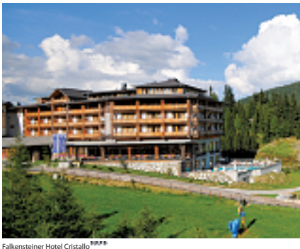
Falkensteiner Hotel Cristallo