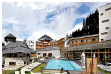
Falkensteiner Club Funimation

Wenn mehr als zwei Kärntner oder Kärntnerinnen auf einer schönen Alm zusammenkommen, wird es lustig und musikalisch. Das gilt auch für die Ferienregion Katschberg zwischen Kärnten und Salzburg. Der Trachtenerlebnistag am 31. August ist dabei erst die Auftaktveranstaltung eines erlebnisreichen Herbstes am Katschberg, der „Katschberger HoamART“ bis zum 19. Oktober 2014, bei der Kultur, Brauchtum und Lebenswelt der Region im Mittelpunkt stehen. Wandern, Brauchtum, Kulinarik und Musik sind die Hauptakteure der sieben Herbstwochen. Drei bis viermal pro Woche spielt auf einer der vielen Almhöfen eine Kärntner oder Salzburger Musikgruppe mit Harmonie auf