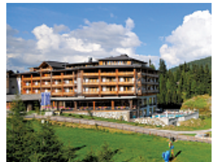
Falkensteiner Hotel Cristallo