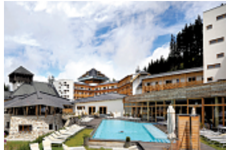
Falkensteiner Club Funimation

Die beiden Falkensteiner Hotels Katschberg bieten Ihnen: Vollpension PLUS inkl. Restaurant-Getränke, tägliche Kinderbetreuung (ab 3 J.) im