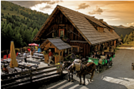
Mit der Pferdekutsche zur Pritzhütte

Wenn mehr als zwei Kärntner oder Kärntnerinnen auf einer schönen Alm zusammenkommen, wird es lustig und musikalisch. Das gilt auch für die Ferienregion Katschberg zwischen Kärnten und Salzburg. Der Trachtenerlebnistag am 31. August ist dabei erst die Auftaktveranstaltung eines erlebnisreichen Herbstes am Katschberg, der „Katschberger HoamART“ bis zum 19. Oktober 2014, bei der Kultur, Brauchtum und Lebenswelt der Region im Mittelpunkt stehen.