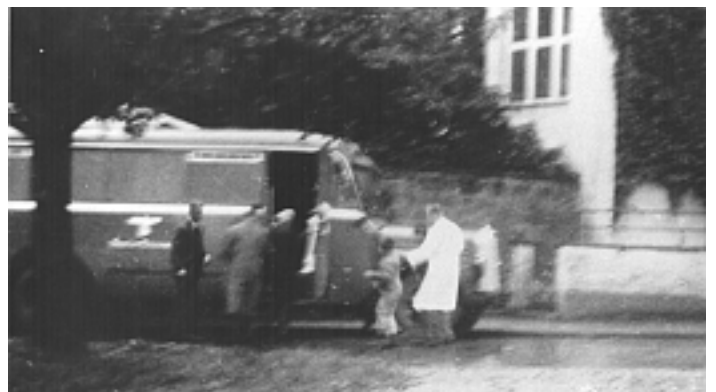
Das Foto zeigt einen der Grauen Busse, mit denen insgesamt 70.000 Menschen zu den verschiedenen Tötungseinrichtungen gebracht wurde. Der Bus auf dem Foto wurde in Stetten im Remstal aufgenommen.

Von der Tiergartenstraße 4 in Berlin aus wurde ab Oktober 1939 bis Herbst 1941 die systematische Erfassung und Ermordung von 70.000 Menschen mit Behinderungen organisiert. Allein 10.600 Menschen starben 1940 in der Gaskammer von Grafeneck. Sie lebten zuvor vor allem in süddeutschen psychiatrischen Krankenhäusern und Heil- und Pflegeanstalten.