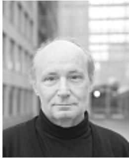
Dr. Eugen Drewermann

Lebenswege-Vortrag mit dem Theologen, Psychoanalytiker und Schriftsteller Dr. Eugen Drewermann