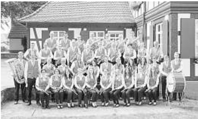
Die Musikerinnen und Musiker vom MV Bodersweier.