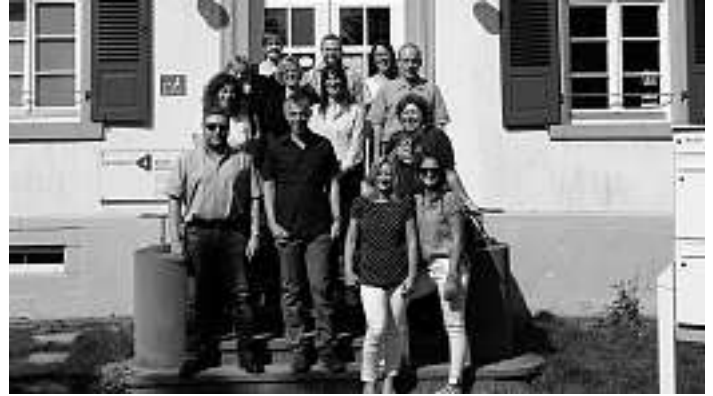
Das Berater-Team des grenzüberschreitenden Sprechtages vor den Räumlichkeiten der INFOBEST Kehl/Strasbourg.

Seit nunmehr über 15 Jahren kommen zu diesem interdisziplinären Beratungstag der INFOBEST Kehl/Strasbourg Berater deutscher und französischer Sozialträger in die Räumlichkeiten der Villa Rehfus in Kehl. Der interdisziplinäre grenzüberschreitende Sprechtag ist mit weiteren Sprechtagen zu sozialversicherungsrechtlichen Themen immer wieder eine willkommene Bereicherung für alle Grenzgänger im Programm der Informations- und Beratungsstelle für alle grenzüberschreitenden Fragen zu Deutschland und Frankreich.