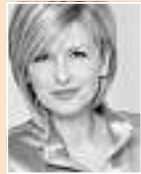
Carmen Nebel TV-Entertainerin, Ehrenmitglied im Kuratorium für Forschung und Wissenschaft

Freiburger Straße 45 77694 Kehl-Auenheim