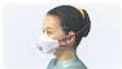
Haltbänder über die Ohren geführt Bei Öffnung der Maske steigt Luft einströmen