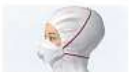
Maske über Koppe getragen Bei Öffnung der Maske steigt Luft einströmen