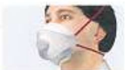
Maske verkehrt herum aufgesetzt Bei Öffnung der Maske steigt Luft einströmen