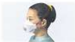
Haltbänder verdrängt Bei Öffnung der Maske steigt Luft einströmen