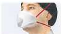
Maske nicht vollständig angesetzt Bei Öffnung steigt Luft einströmen durch ungenügende Anheftung