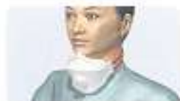
Maske am Hals getragen Schutzwirkung vermindert, Mund und Nase freigelegt