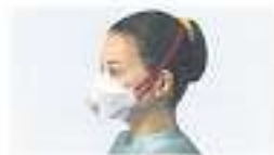
Haltbänder falsch positioniert Bei Öffnung der Maske steigt Luft einströmen