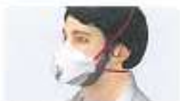
Maske mit Bart getragen Nicht dicht zur Gesichtshaut, Luft einströmen durch Lücken