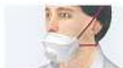
Maske nicht über Nase getragen Nose kommt bei ungenügender Montage zwischen Lippen