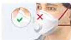
Nasenbügel nicht angepasst Bei Öffnung der Maske steigt Luft einströmen durch Nasenbügel