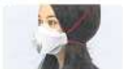
Haar nicht zusammen gebunden Bei Öffnung der Maske steigt Luft einströmen