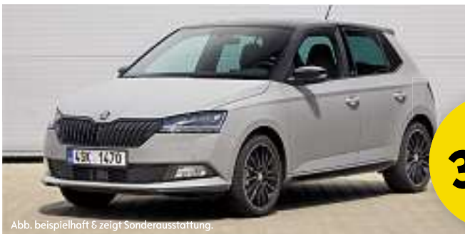
Abb. beispielhaft & zeigt Sonderausstattung.