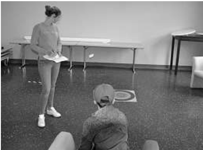
FKU-Olympiade-1: Beim Spielkartenweitwurf ist volle Konzentration angesagt.