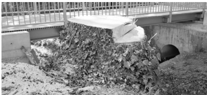
Weil die Standsicherheit der Esche gefährdet war, hat der Betriebshof den Baum gefällt.

Kehl – Teilweise kahle Äste und abgestorbene Triebe in der Baumkrone sowie ein holzersetzender Pilz im Wurzelbereich, der die Standfestigkeit beeinträchtigte: Eine kranke und beschädigte Esche zwischen Kandelstraße und Kinzigallee musste aus Sicherheitsgründen gefällt werden. Zuvor war ein Ast des Baumes bei Erneuerungsarbeiten der Fußgängerbrücke über den Riedgraben von einem Baustellenfahrzeug abgerissen worden. Ein zur Schadensbewertung des Unfalls hinzugezogener Sachverständiger stellte daraufhin fest, dass die Esche vermutlich am Eschentriebsterben litt und zudem vom sogenannten Lackporling – einer Pilzart – im Wurzelbereich befallen war. Dieser holzersetzende Pilz breitet sich meist von der Baumwurzel über Jahre nach außen aus und sorgt dafür, dass ein Baum seine Standfestigkeit verliert. Weil die Esche dadurch eine Gefährdung für Auto- und Radfahrende sowie Fußgängerinnen und -gänger darstellte, empfahl der Sachverständige eine rasche Fällung, die vom Betriebshof am 4. August vollzogen wurde.