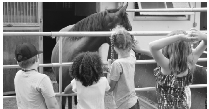
Während der Wartezeiten durften die Kinder die Pferde in den Ställen bestaunen.