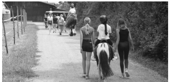
Die Kinder durften unter Aufsicht einmal rund um das Gelände des Reit- und Fahrvereins Kehl reiten.