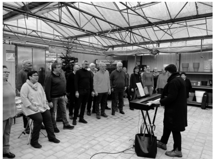
Das obige Bild gibt einen kleinen, unvollständigen Eindruck von der Veranstaltung bei 1A Garten Hopp wieder.